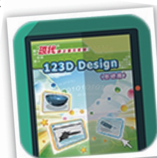
《現代網上單元》 系列